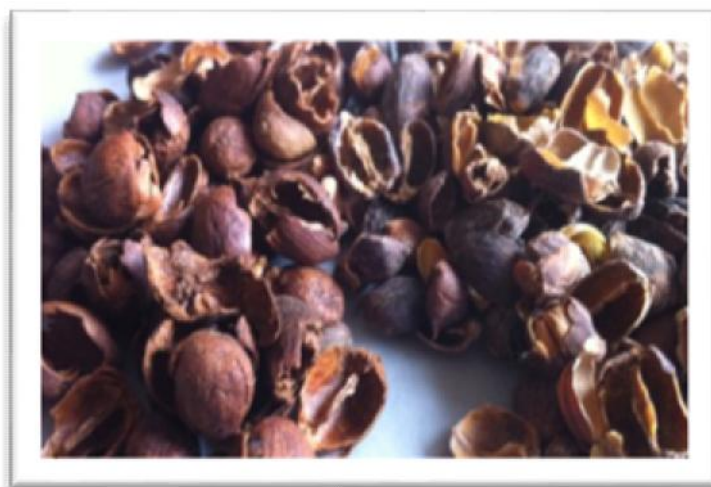
Cáscara del café (sultana), Pacheco et al., pp. 117-126